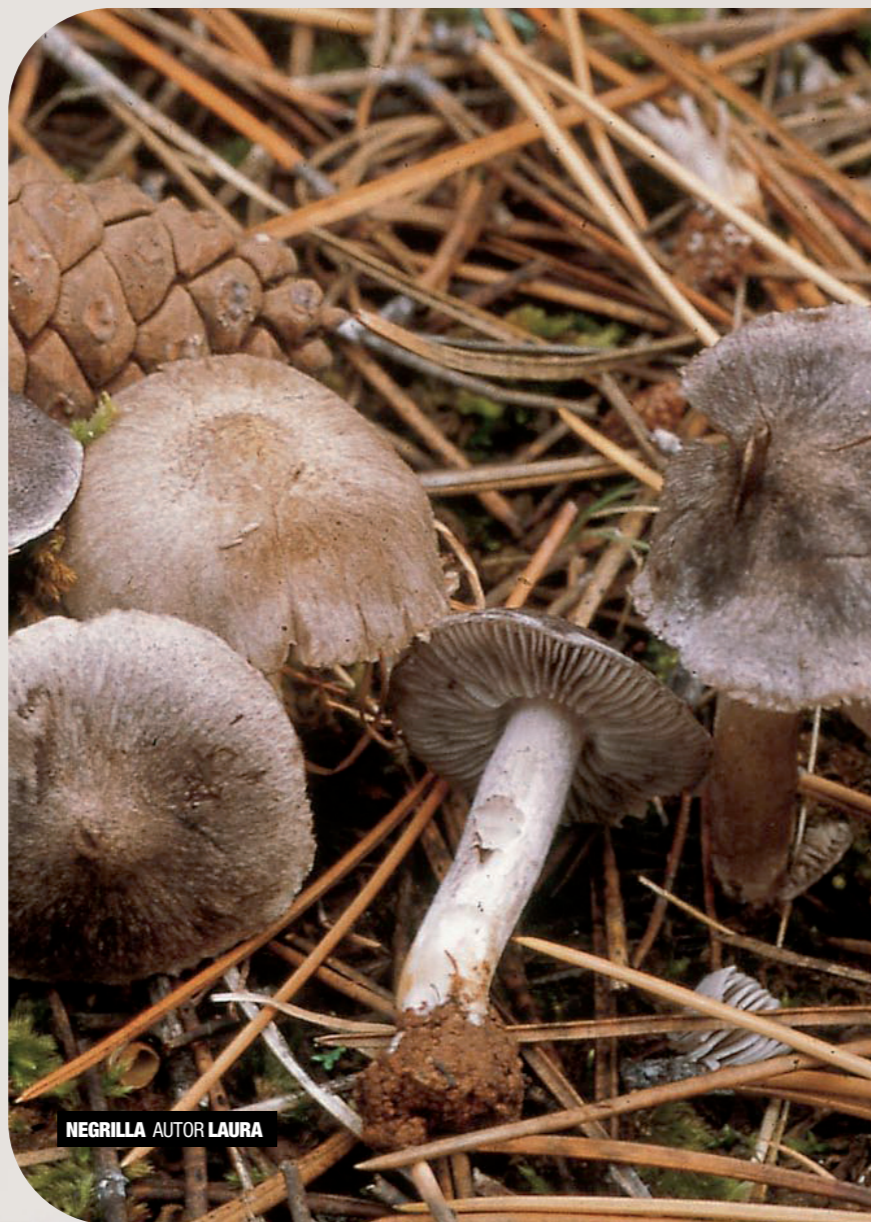
NEGRILLA AUTOR LAURA